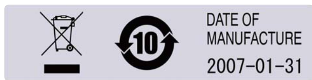
UL認定ラベルの印字例

UL認定により難燃材料が証明されたラベルです。お客様のUL認定製品に貼り付けるラベルとして、面倒な認定申請を行うことなく、ご使用いただけます。 ※お客様の製品の認定は別途必要です。