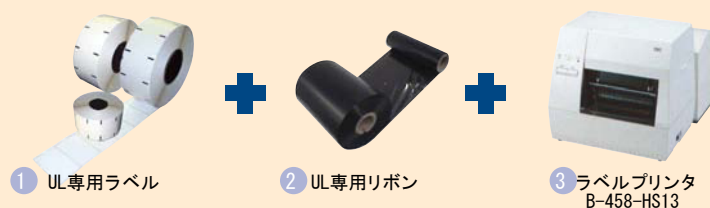
1 UL専用ラベル 2 UL専用リボン 3 ラベルプリンタ B-458-HS13

※UL規格ではプリンタが規定されませんが、リボンの規定によりプリンタの種類が限定されます。