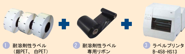
1 耐溶剤性ラベル (銀PET、白PET) 2 耐溶剤性ラベル専用リボン 3 ラベルプリンタ B-458-HS13