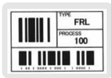
耐溶剤性ラベルなら、消えることはありません